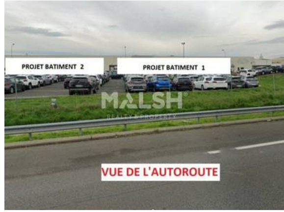
S DE COMMERCIALISATION 3550 - Insertion du projet dans son environnement